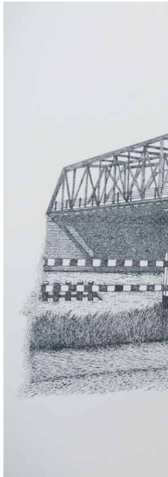
↑ Verbinding - de Vlaktebrug gezien vanaf de oostzijde van het kanaal van Zuid-Beveland, situatie na de oplevering in 1938, pentekening op Japans papier, 2016, 400 mm x 600 mm.

E. van Blankenstein, Bruggen in Nederland, Vernieling en herstel, 1940-1950 , Zutphen 2009. J. Cats, 'Kanaal verhaal', in: Zeeland Boek Brochures , nr. 6, Vlissingen 1992.