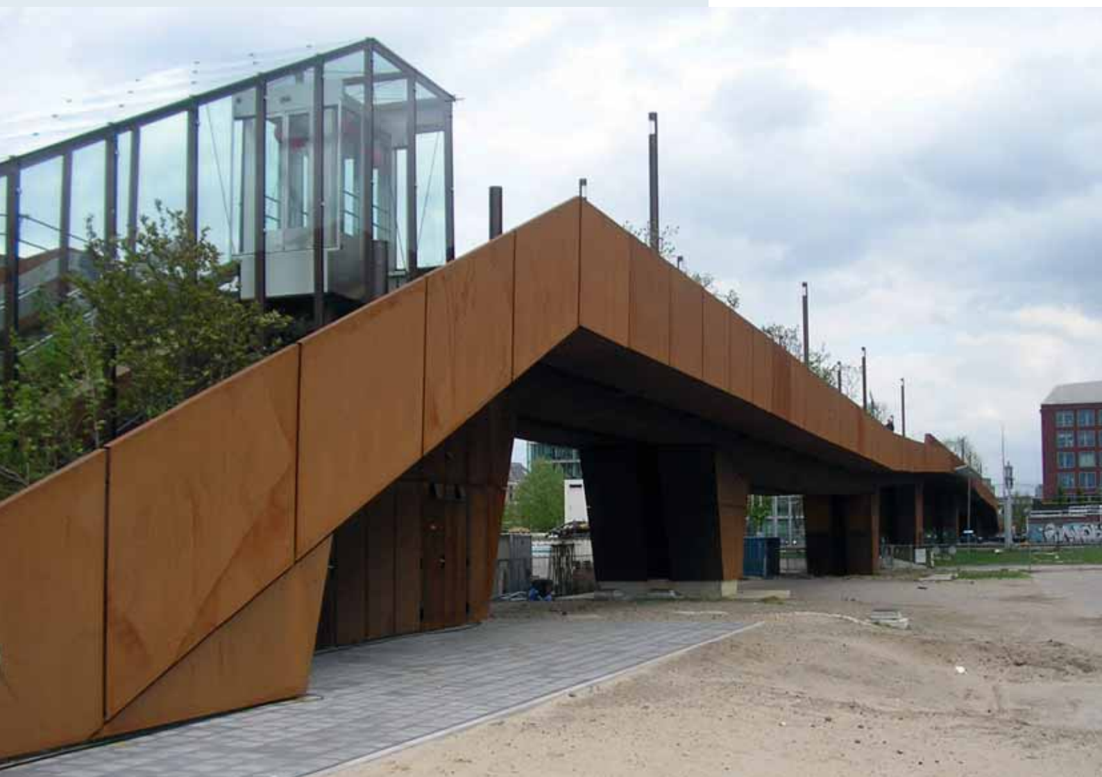
Naast de trap de glazen lift.