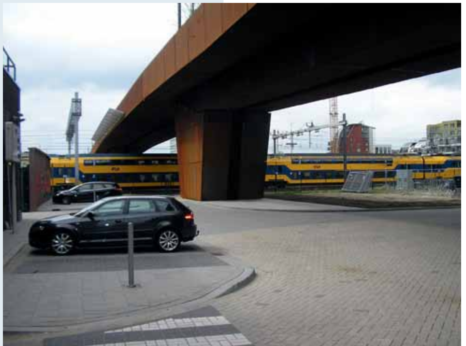
Het is een echte spoorbrug

De Paleisbrug overspant een flink aantal sporen in de routes tussen Den Bosch en Eindhoven, maar ook tussen Den Bosch en Tilburg