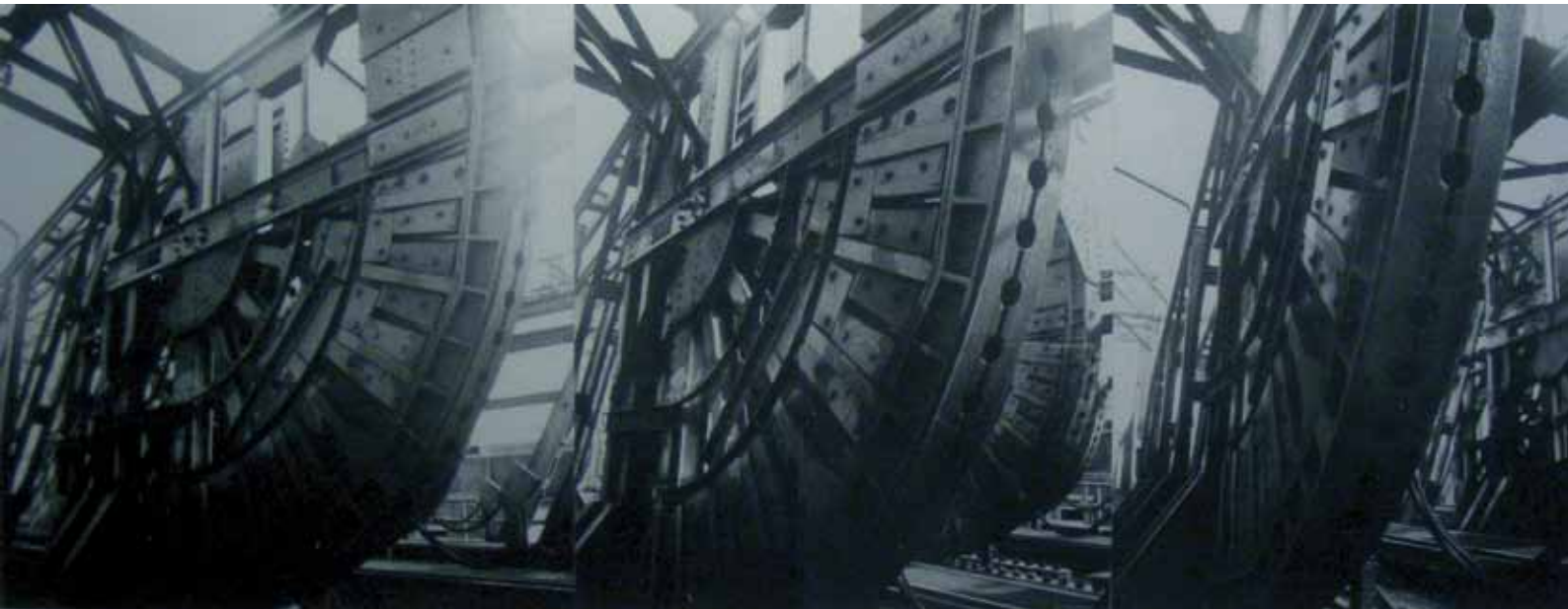
ER DE AS DER BRUG.