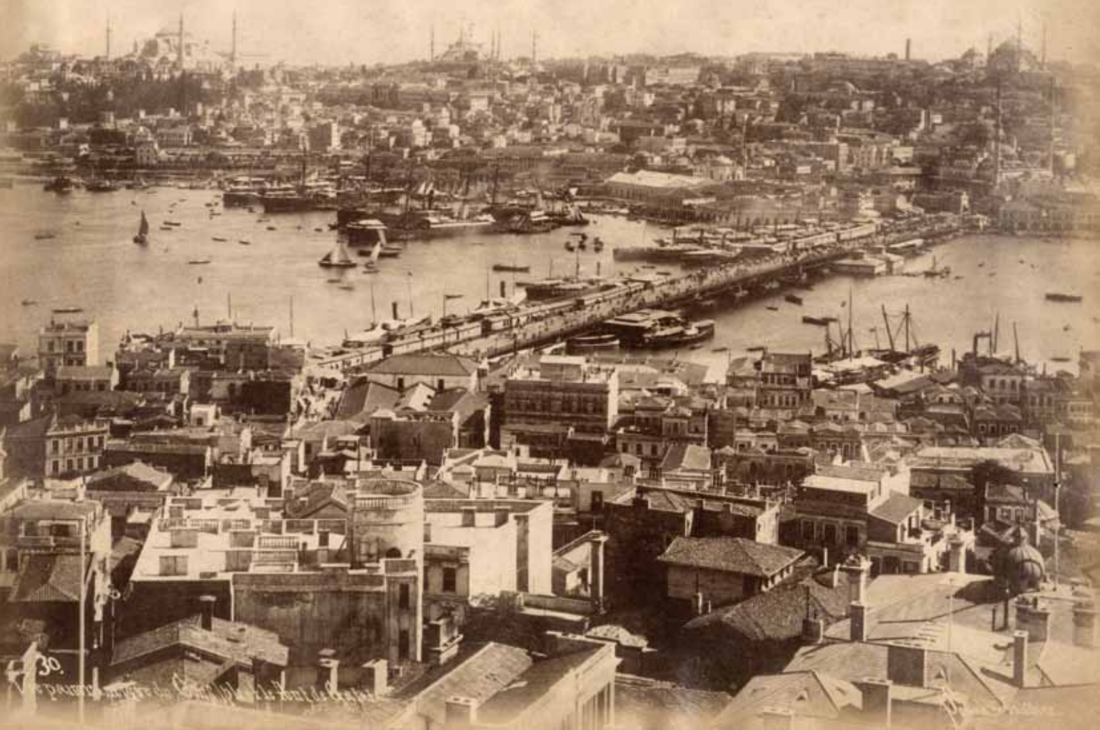
'Vue panoramique de Constantinople et le pont de Galata', albuminedruk, foto gemaakt door Sebah&Joaillier, ca. 1890 (collectie Nationaal Archief, archief Middelberg, inv.nr. 105). Afdruk door Middelberg ter plaatse gekocht.

Nadat er aan boord gegeten is wordt de stad nog eens bezocht en s 'avonds nog een keer. '(we) drinken uitstekend Duitsch bier; om elf uur zijn we weer aan boord terug'.