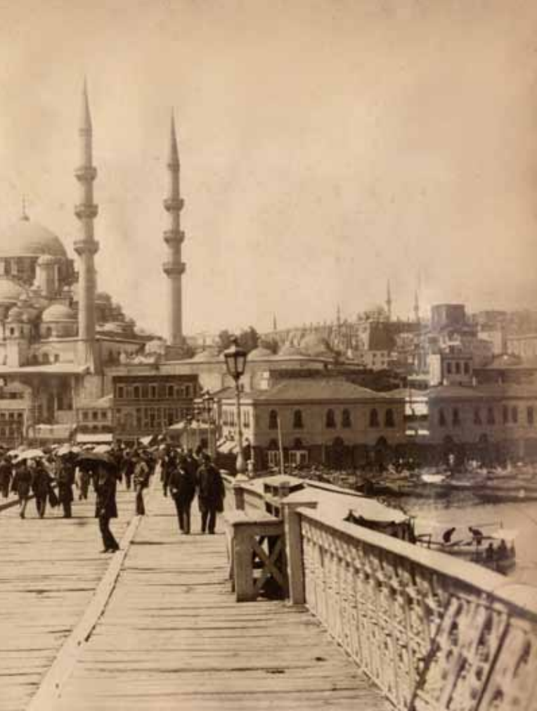
De Galata brug, Constantinopel, albuminedruk, foto gemaakt door Sebah&Joallier, ca 1890 (collectie Nationaal Archief, archief Middelberg). Afdruk ('lichtdruk') door Middelberg ter plaatse gekocht.