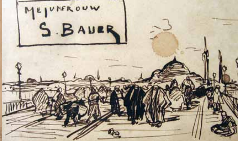
Galata-brug, tekening door Marius Bauer, dinerkaartje 25 jan. 1889 (particuliere collectie)

Op zondag 12 juli (dag 22 van de reis) kwamen ze aan te Constantinopel: 'Om 5 uur kom ik aan dek. De zon beschijnt reeds weer de blauwe zee. Links vooruit is reeds een flauwe verhevenheid aan den horizon te