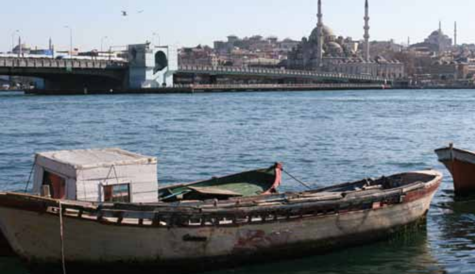
Galatabrug in 2005

Het is een geraas, een getier, een gegil van vreemde woorden, van keelklanken, aspiraties, onverstaanbare uitroepen, waar tusschen de enkele fransche en italiaansche woorden, die af en toe het oor bereiken, den indruk maken van lichtpunten in eene volslagen duisternis.'